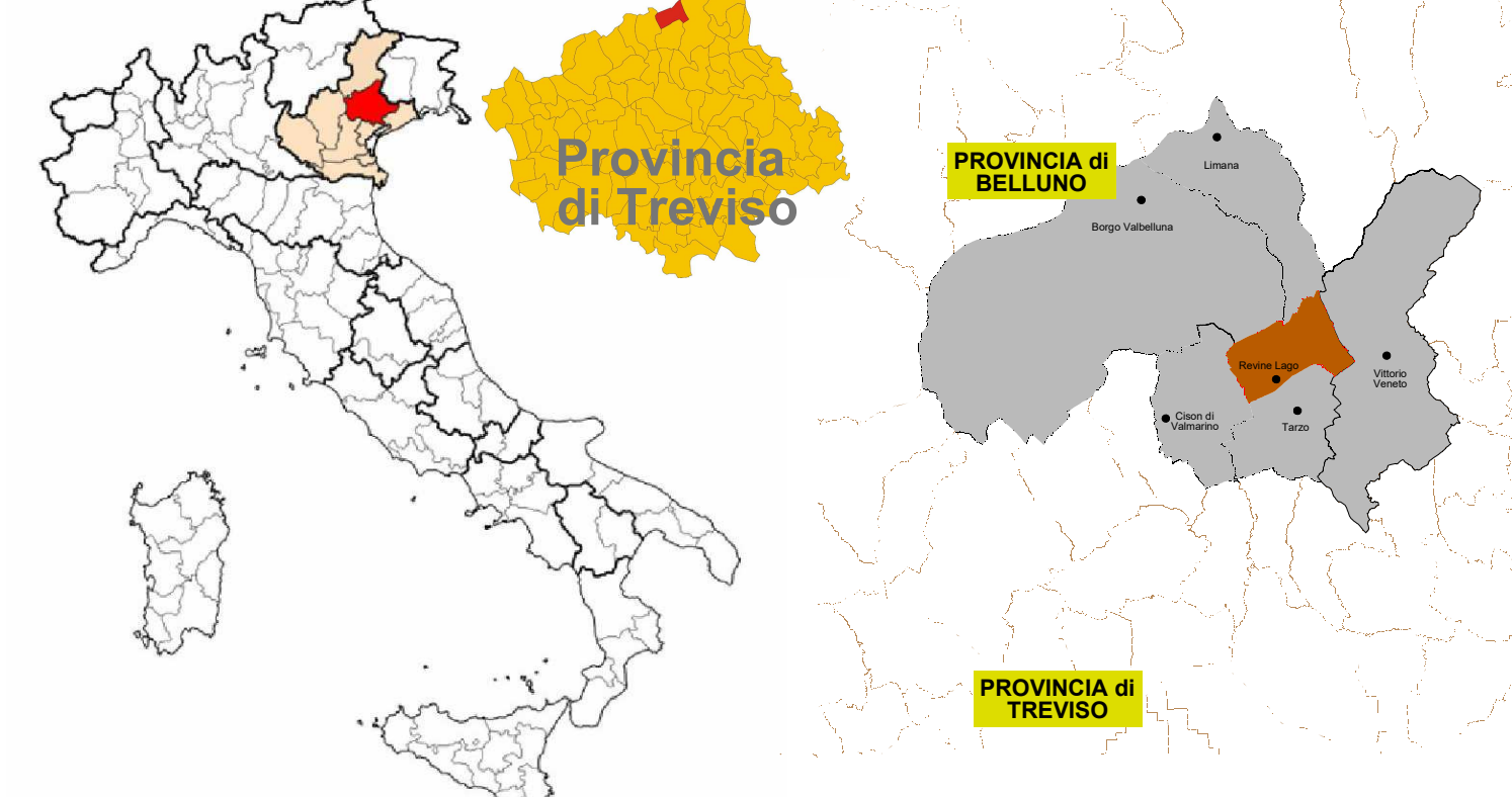
Inquadramento del Territorio Comunale di Revine Lago e dei comuni limitrofi